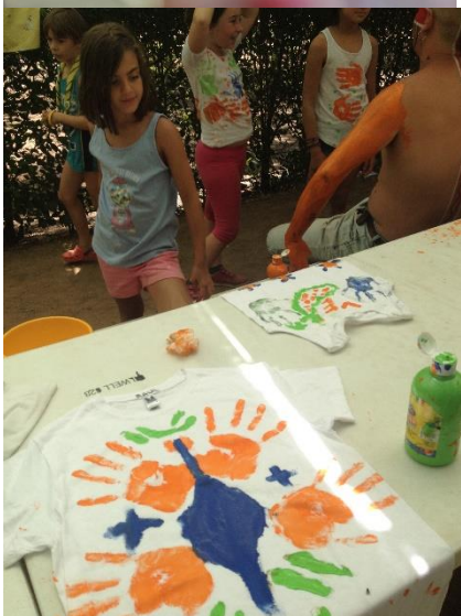
[campamento Badajoz julio 2016 ]