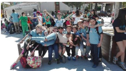
[Festijorge Ronda 2015-16, Tropa]